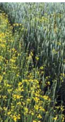
Figur 2. Vårhvede sået på tre måder, hvor raps (gule blomster) er sået som »ukrudt« (200 pr. m 2 ). Til venstre: Vårhvede sået i lav tæthed (200 pr. m 2 ). I midten: Vårhvede sået i høj tæthed (600 pr. m 2 ) i normale rækker. Til højre: Vårhvede sået i høj tæthed (600 pr. m 2 ) i et uniformt mønster

I et treårigt projekt bevilget af Statens Jordbrugs- og Veterinærvidenskabelige Forskningsråd, har vi ►